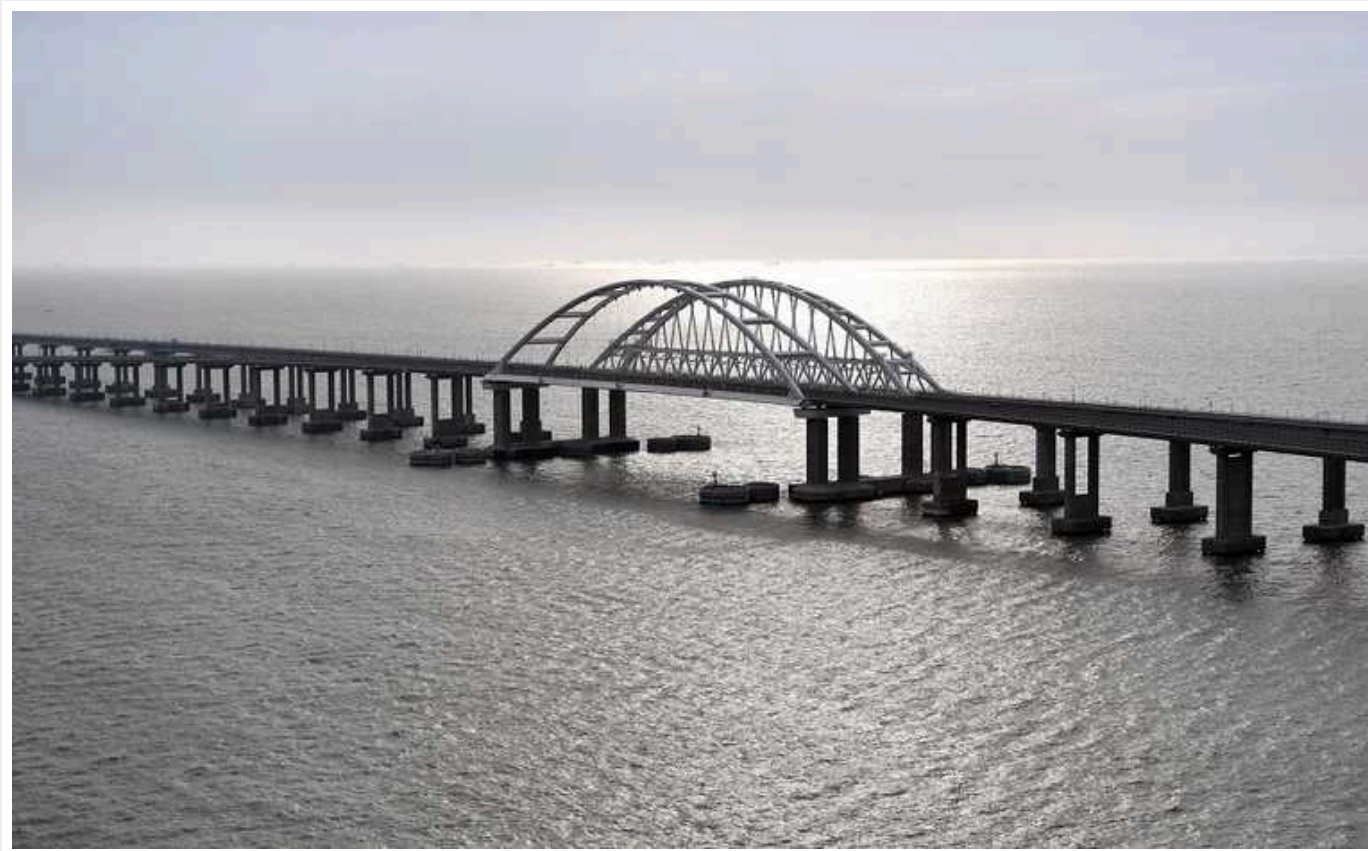
В окупованому Севастополі оголосили повітряну тривогу