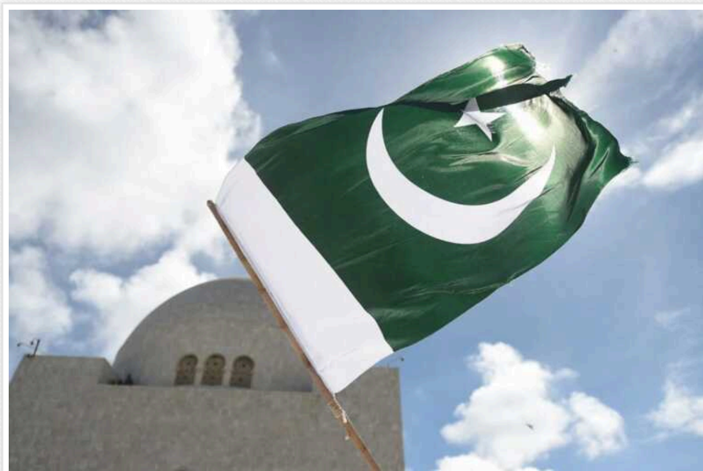
Пакистан пригрозив Ірану відповіддю на ракетний удар

Пакистан заявив, що "залишає за собою право відреагувати" на ракетний удар з боку Ірану.