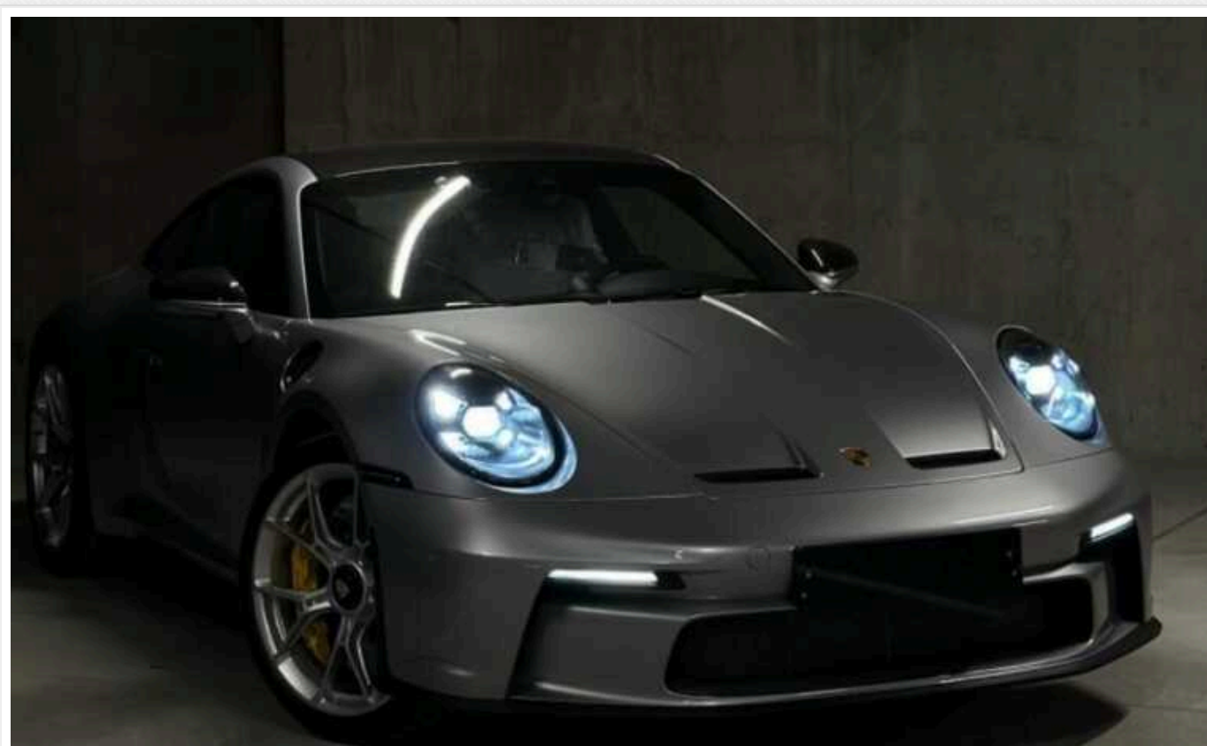
В Україні з'явився рідкісний спорткар Porsche за 9 мільйонів

Купе Porsche 911 GT3 Touring оснащено високооборотистою 4,0-літровою шісткою на 510 сил. Спорткар здатний розігнатися до 100 км/год за 3,2 с і розвинути 320 км/год.