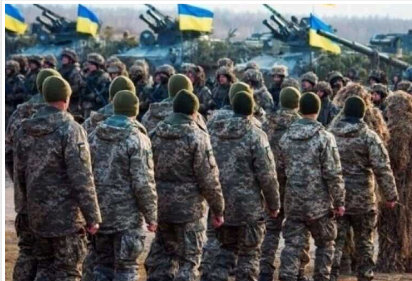
Кого з чоловіків під час мобілізації призвуть до ЗСУ через службу зайнятості

Державна служба зайнятості допомагатиме чоловікам працевлаштуватися до ЗСУ. Громадяни зможуть самостійно обирати спеціальності та підрозділи для служби, розповіла міністерка економіки Юлія Свириденко.