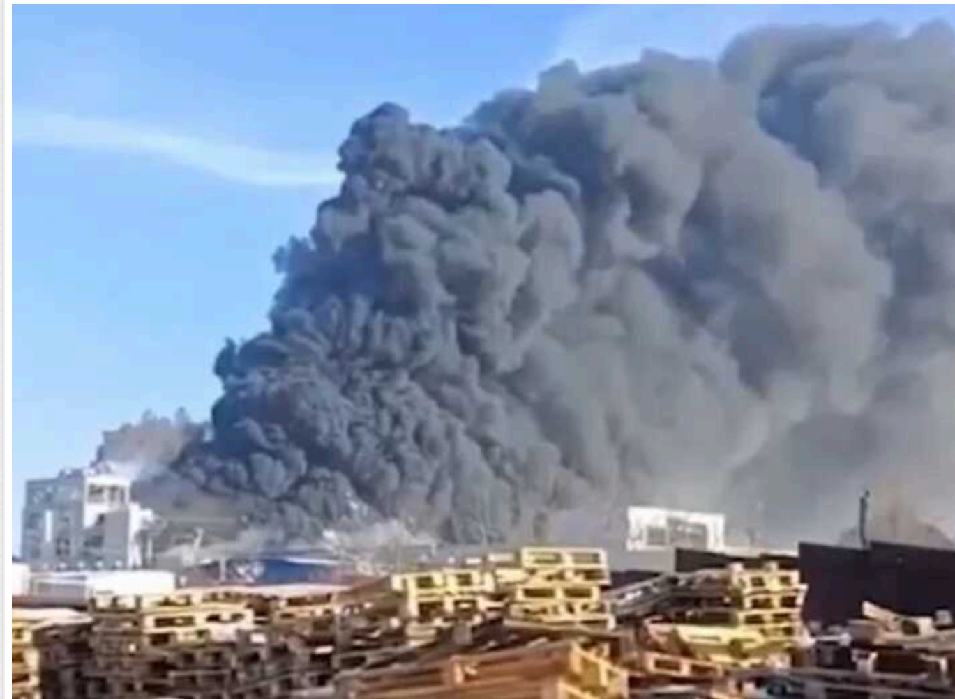
У Ростовській області момент вибуху на заводі потрапив на відео

Вранці 17 січня у Ростовській області РФ спалахнула масштабна пожежа на полімерному заводі "Авангард". Деякі російські пабліки стверджували, що причиною займання стало замикання проводки, а місцеві жителі розповідали, що перед пожежею чули потужний вибух.