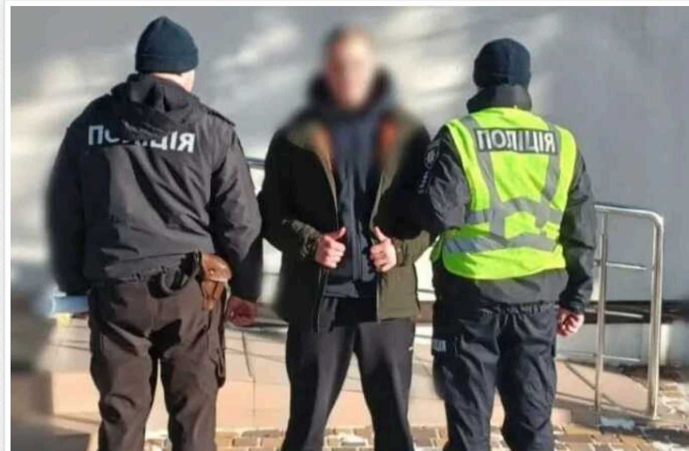
На Київщині чоловік обікрав ювелірку на очах продавчині, розбивши вітрину магазину

У Боярці Київської області чоловік на очах продавчині розбив вітрину ювелірного магазину та вкрав ювелірні вироби. Після цього зловмисник втік з місця події.