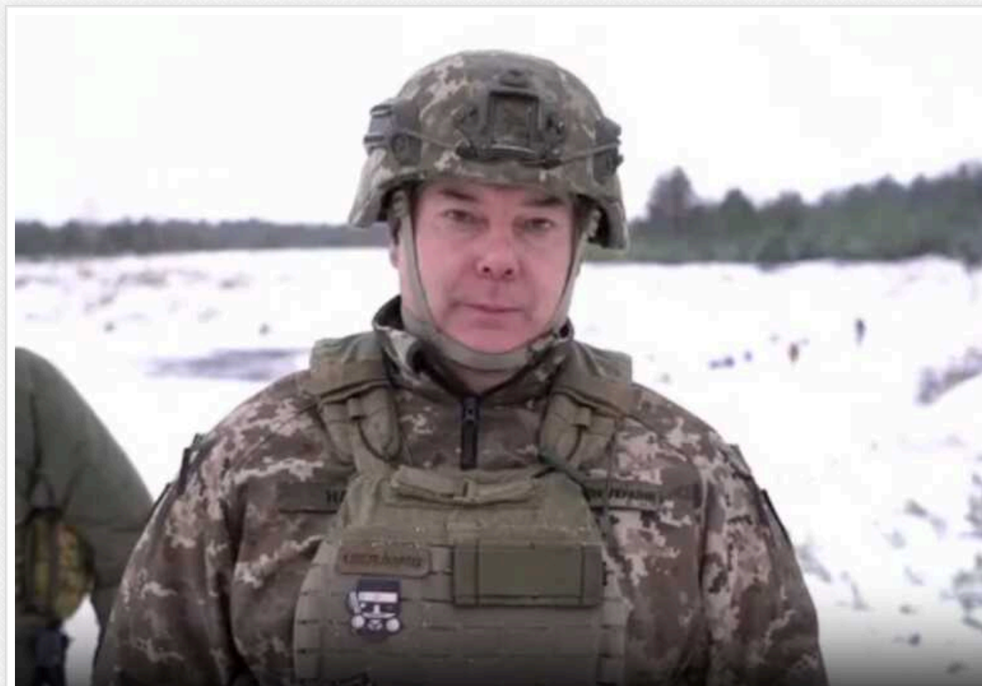
Наєв розповів про ситуацію у Північній операційній зоні: "За кожний постріл окупант отримує гідну відповідь"

Російські окупаційні війська щодня завдають ударів по прикордонних районах Сумської та Чернігівської областей з різних видів зброї. Захисники України дають гідну відповідь на кожен постріл ворога та намагаються діяти на випередження.