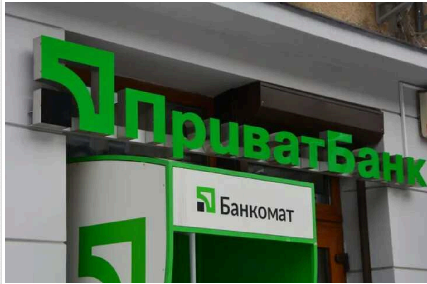
ПриватБанк вимагає повернути гроші і заблокував рахунок: за що можуть покарати будь-кого

Українець отримав переказ за продаж криптовалюти, після чого його картку у ПриватБанку заблокували. Тепер, щоб розблокувати рахунок, йому потрібно надати рішення суду про те, що він не брав участі у шахрайській схемі. Або повернути гроші жертві шахрайства.