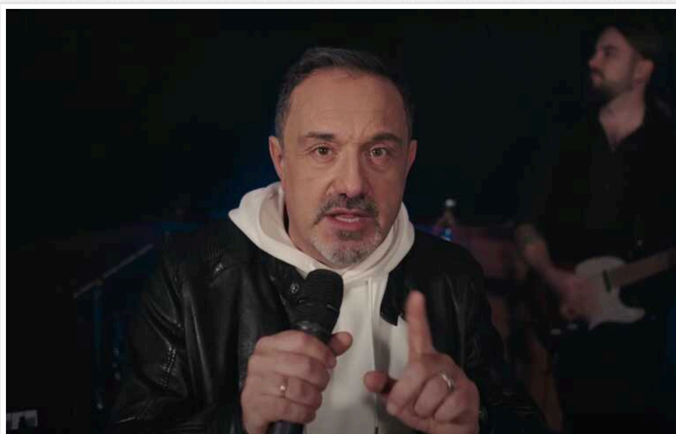
Гарік Кричевський пояснив, чому не пішов захищати Україну

Легендарний шансонний співак Гарік Кричевський відправив себе на лаву запасних, заявивши, що у війську його робота була б марною, адже кожен має виконувати свою справу: військові – воювати, співаки – співати. Артист закінчив медичний інститут, тому його могли безпроблемно мобілізувати на фронт як бойового медика, адже на початок повномасштабного вторгнення Росії він мав 58 років.