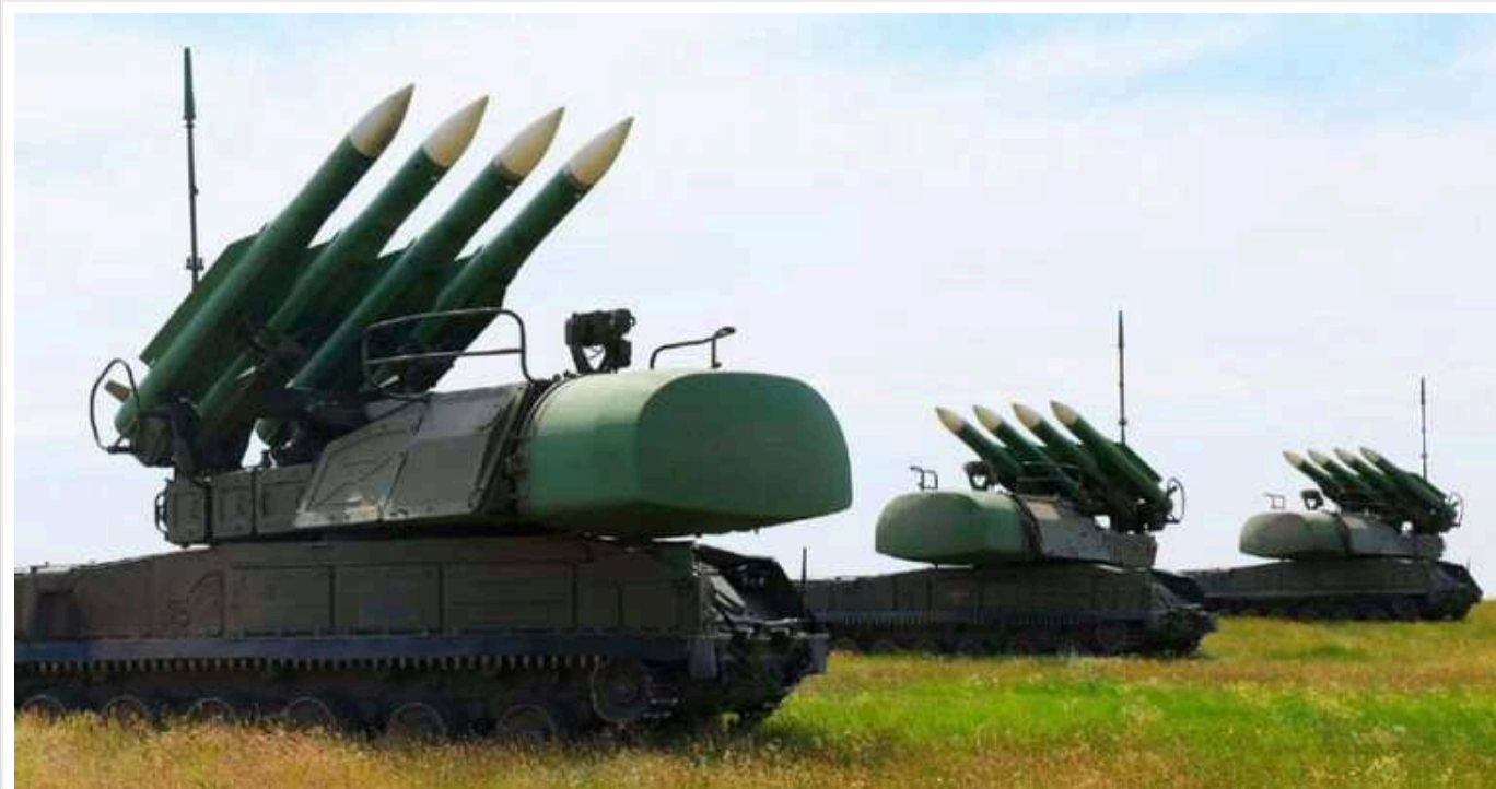
В Україні вперше застосували систему ППО проєкту FrankenSAM. Вона збила "Shahed" з відстані 9 кілометрів, – Камішін

FrankenSAM – це гібридні системи ППО, якими спільно займаються Пентагон, Міноборони України та Мінстратегпром.