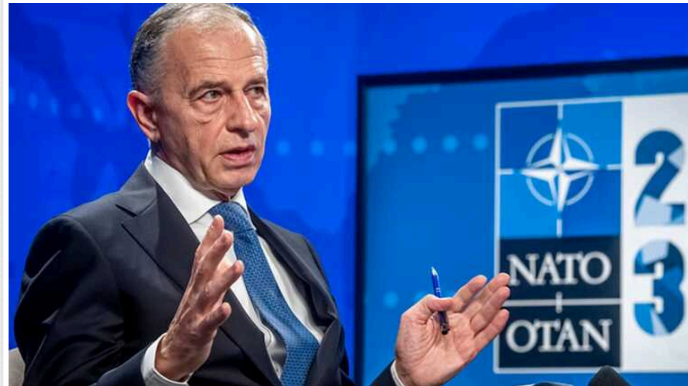
У НАТО заявили, що на саміті у Вашингтоні Україна буде одним з пріоритетів

Україна буде одним з пріоритетів на наступному саміті лідерів країн НАТО. Він відбудеться у Вашингтоні у липні 2024 року.