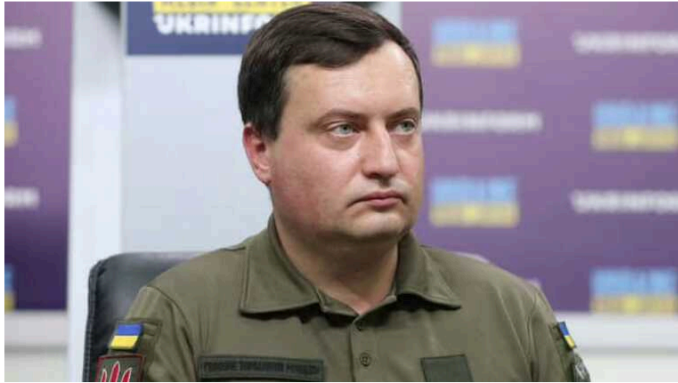
Окупанти на окупованих територіях хочуть збільшити кількість Росгвардії та ФСБ через провал паспортизації - Юсов

Головне управління розвідки заявляє, що Росія незадоволена низьким рівнем паспортизації українського населення на тимчасово окупованих територіях та готовністю до проведення виборів президента, тому планує збільшити кількість Російської гвардії та спецслужб на тимчасово окупованих територіях.