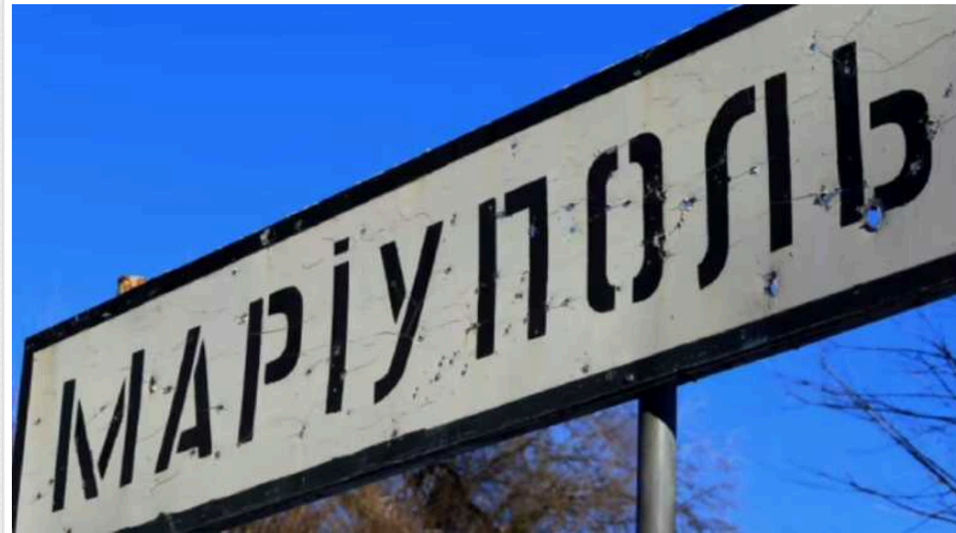
В окупований Маріуполь окупанти звезли 50 тисяч мігрантів з РФ та Центральної Азії – ЦНС

Росія звезла до Маріуполя щонайменше 50 тисяч заробітчан із депресивних регіонів Російської Федерації та країн Центральної Азії.