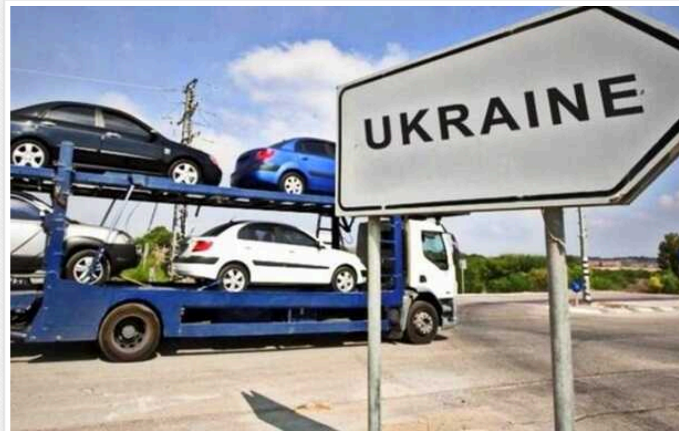
Як блокування польського кордону вплинуло на імпорт авто в Україну

Через блокування поляками українського кордону динаміка оформлень по імпорту автотранспорту на регіональних митницях не зазнала вагомих змін. Але загалом з початку року зросли оформлення на деяких інших митницях, зокрема, Волинській. За період блокування змінилася кількість легкових автомобілів, які ввозили великими автовозами.