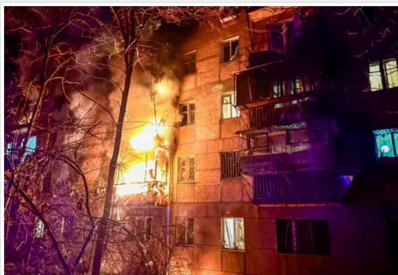
З'явилися нові деталі та фото наслідків атаки дронів на Одесу

У ніч проти 17 січня російські війська атакували дронами-камікадзе Одесу. Унаслідок атаки руйнувань зазнав багатопверховий будинок: у квартирах одеситів спалахнули пожежі.