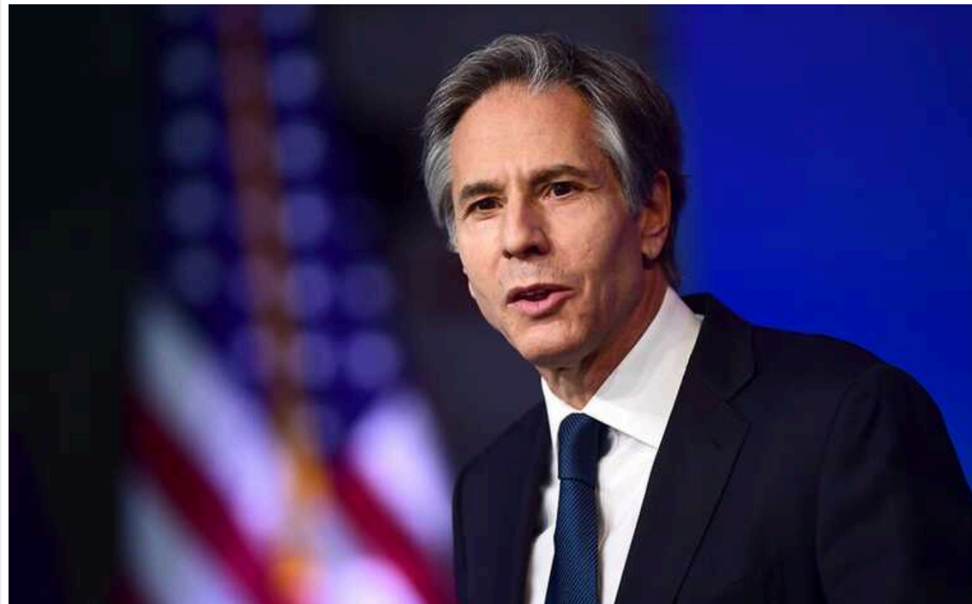
Блінкен попередив про ризики залишити Україну без допомоги США

Якщо Конгрес США не схвалить пакет допомоги Україні, запропонований президентом Джо Байденом, то це буде для Києва справжньою проблемою в умовах війни з Росією.