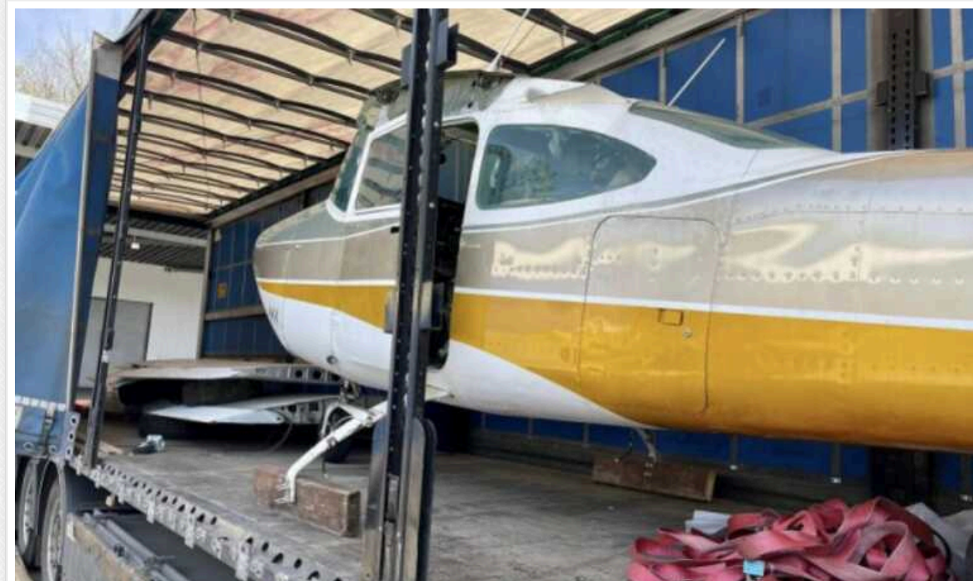
Автівки, літаки та військове спорядження: митники передали оборонцям конфісковані товари на 473,9 млн гривень

З 24 лютого 2022 року військові отримали зі складів митниці конфісковані товари та транспортні засоби на 473,9 млн грн. Зокрема, одному з підрозділів ЗСУ митники передали літак для виконання бойових завдань.