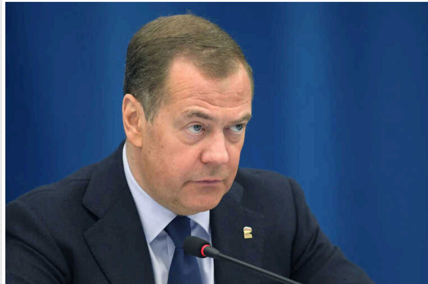
Медведєв назвав існування України "смертельно небезпечним" і заговорив про ймовірність нової війни

Колишній президент країни-агресорки, а нині заступник голови Радбезу Росії Дмитро Медведєв заявив, що існування незалежної України "смертельно небезпечно" для її населення. При цьому одіозний російський політик зазначив, що це завжди буде приводом для відновлення бойових дій, незалежно від того як буде змінюватися влада в Україні.