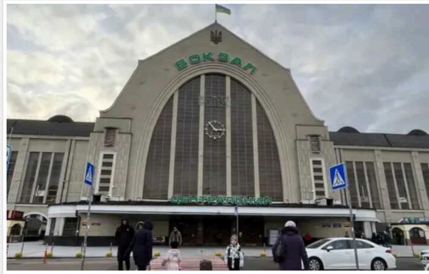
У Києві затримали злодія, який на залізничному вокзалі обікрвав пенсіонерку, що спала

У Києві на Центральному залізничному вокзалі раніше судимий чоловік обікрвав пенсіонерку, яка заснула очікуючи на свій потяг. Зловмисника оперативно затримали правоохоронці.