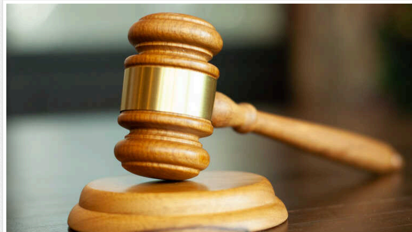
У Києві суд виніс вирок зловмиснику, який до смерті забив битою пенсіонера

У столиці суд виніс вирок киянину, який дерев'яною битою завдав тяжких тілесних ушкоджень 66-річному чоловіку. Від отриманих травм пенсіонер помер у лікарні.