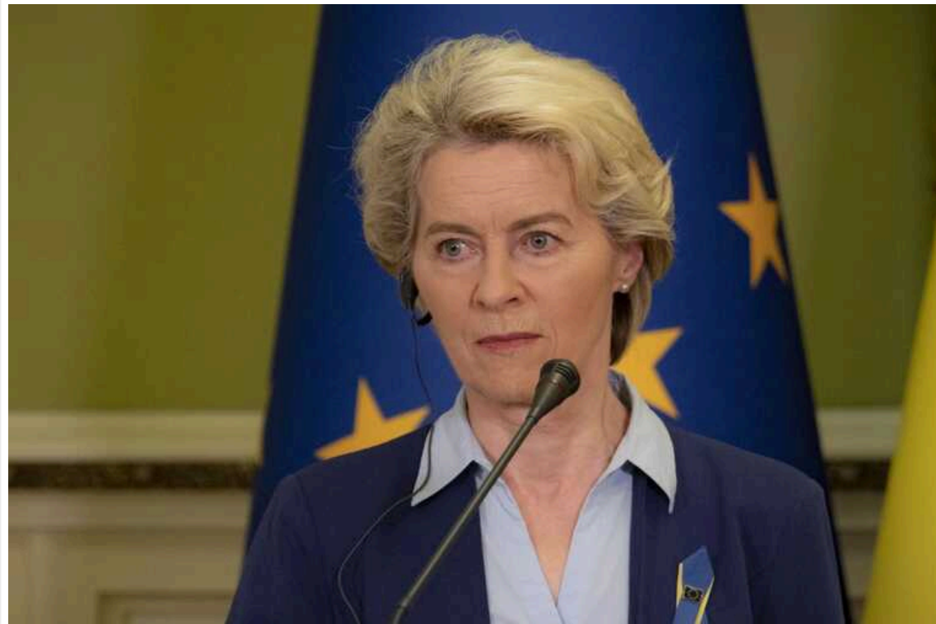
Урсула фон дер Ляен заявила про початок скринінгу законодавства України

Президентка Єврокомісії Урсула фон дер Ляен заявила про початок скринінгу законодавства України. Також вона анонсувала формування переговорної рамки про членство України в ЄС.