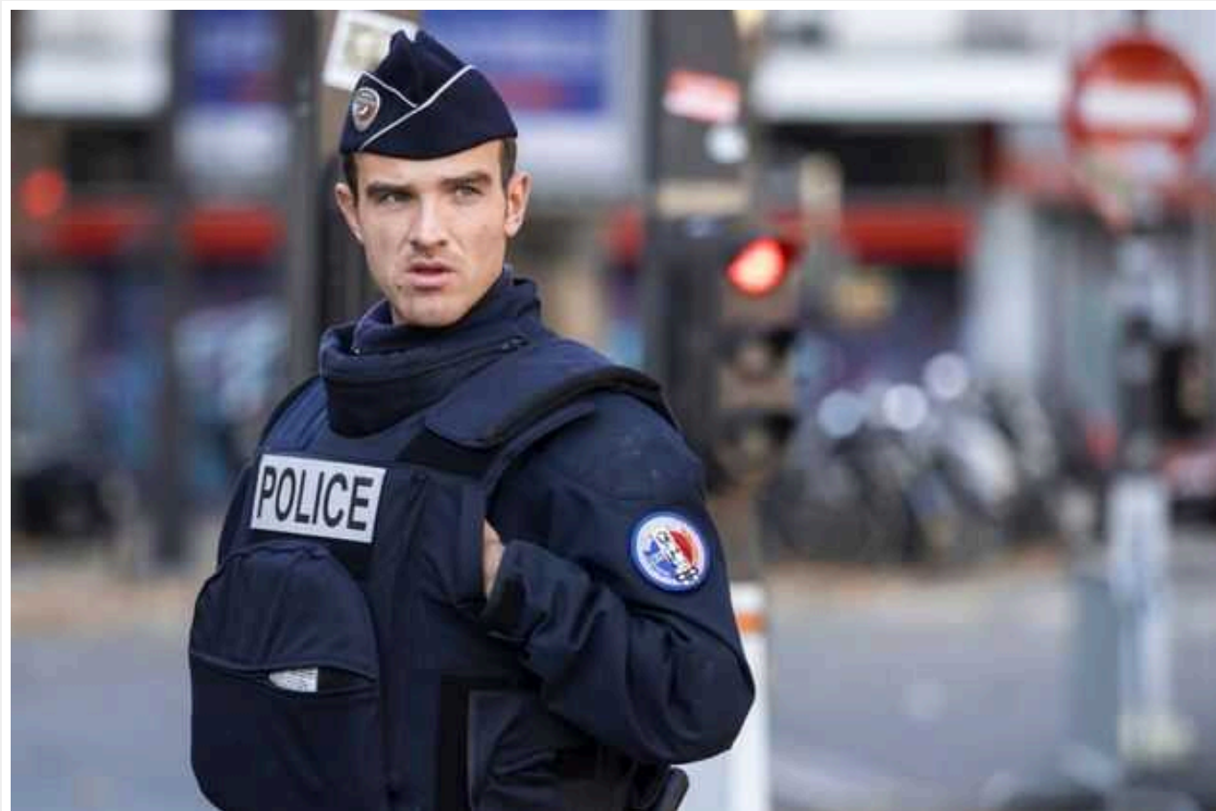
На півночі Франції перехопили транспорт із 40 нелегалами

Французька поліція повідомила про перехоплення на півночі країни транспортного засобу, у якому перевозили 40 нелегальних мігрантів.