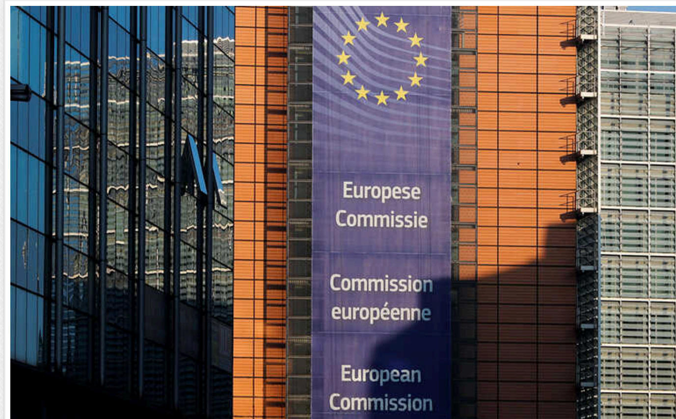
Запит Польщі відновити квоти на імпорту сільгосппродукції з України було відхилено Європейською комісією, – Секерський

Польща звернулася до Європейської комісії з проханням відновити тарифні квоти для деяких українських продуктів, але отримала відмову.