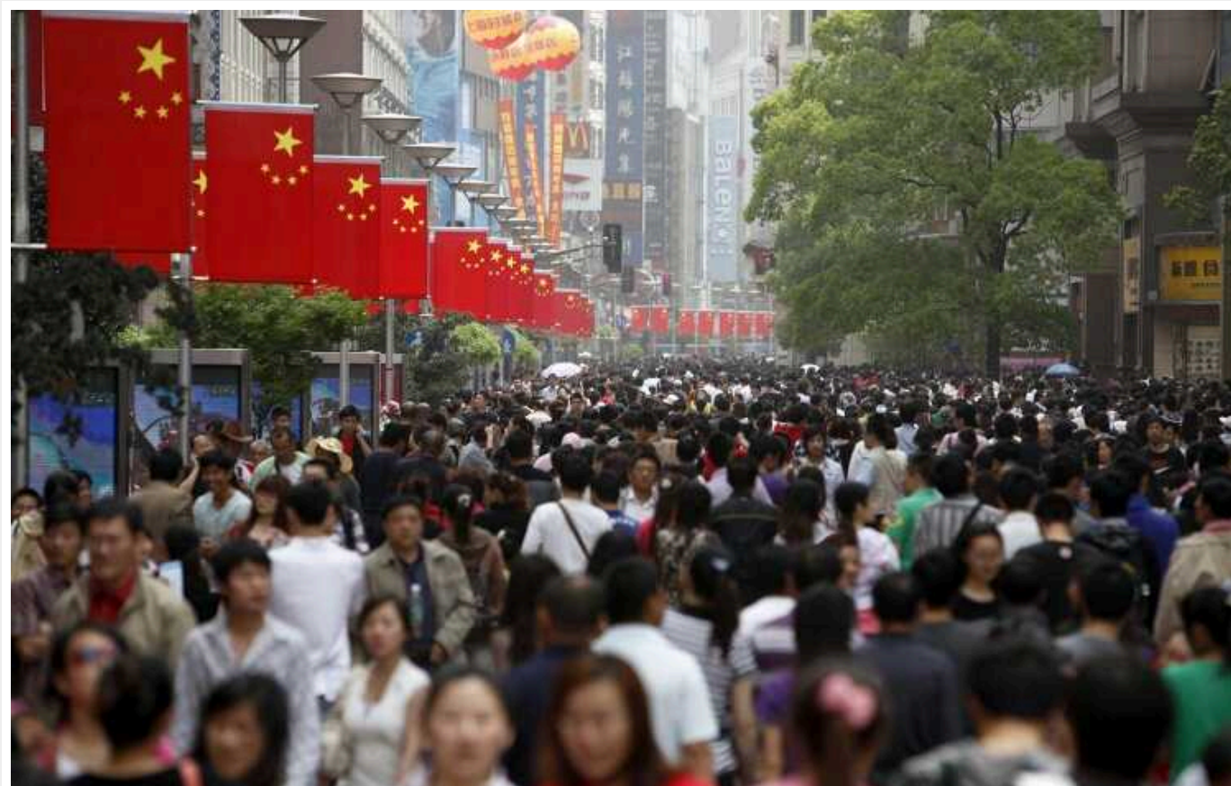
У Китаї другий рік поспіль зменшується народжуваність

Населення Китаю у 2023 році скорочувалося другий рік поспіль через рекордно низький рівень народжуваності та смерті від коронавірусу. За даними Національного бюро статистики, загальна кількість жителів країни скоротилася на 2,08 мільйона осіб – до 1,409 мільярда.