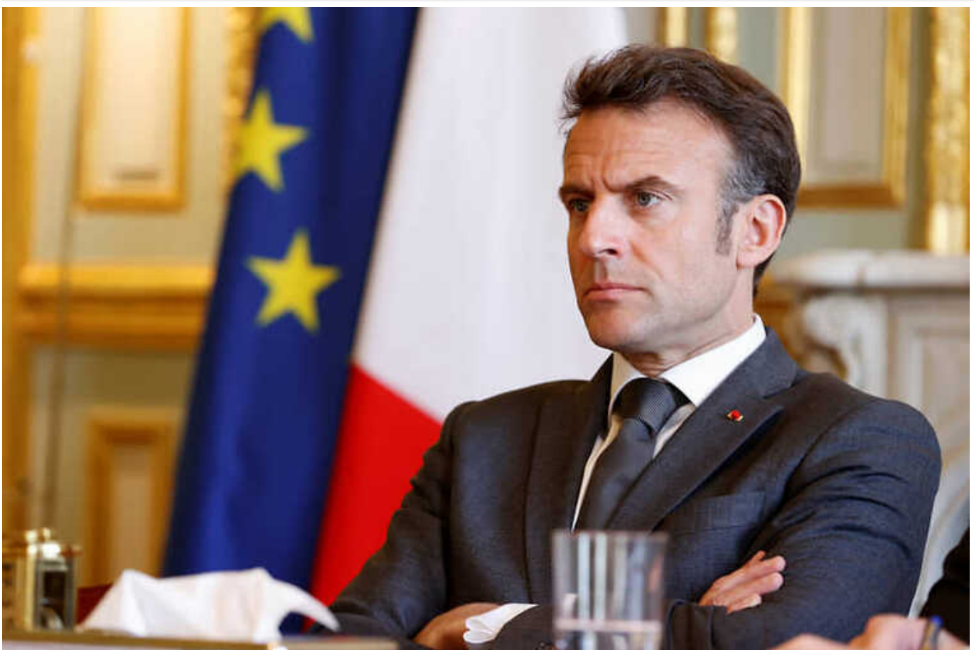
Президент Франції прокоментував можливе повернення Трампа до влади

Президент Франції Емманюель Макрон після перемоги експрезидента США Дональда Трампа на перших республіканських праймериз в Айові заявив, що буде співпрацювати з тим, хто переможе на виборах у США.