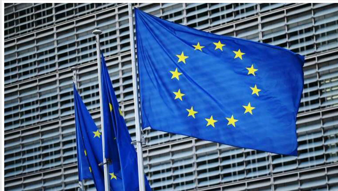
В Євросоюзі впевнені, що угоду про 50 мільярдів євро для України узгодять за кілька тижнів, – ЗМІ

В Європейському Союзі впевнені, що угоду про чотирирічний пакет фінансування на 50 млрд євро для України буде ухвалено, попри погрози Угорщини. Це може статися протягом найближчих кількох тижнів.