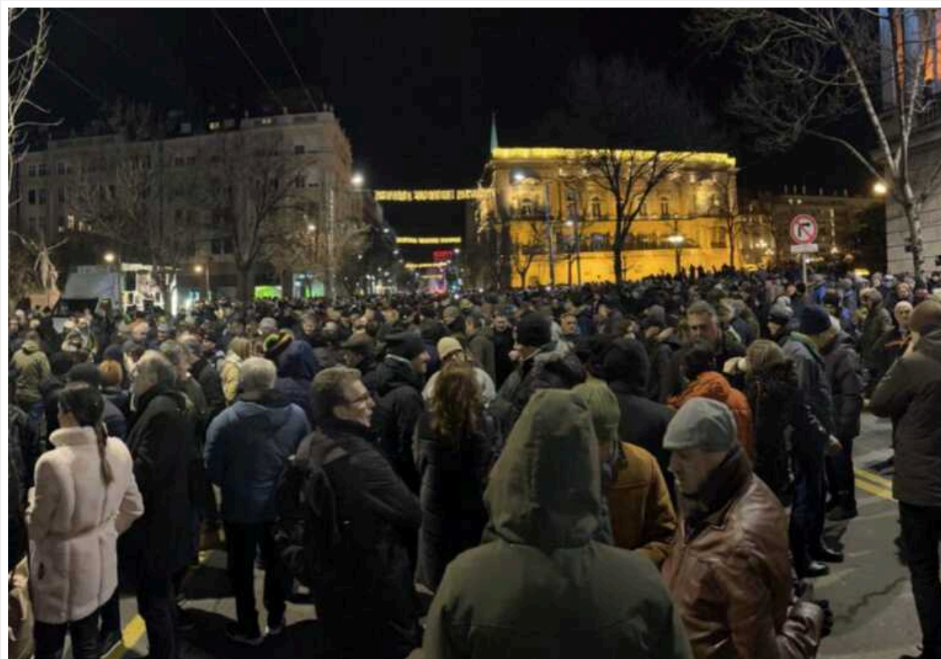
У Сербії через фальсифікації на виборах відновились протести

Прихильники сербської опозиції знову вийшли на протест у вівторок, звинувачуючи популістський уряд президента Александара Вучича в організації фальсифікацій на парламентських і місцевих виборах минулого місяця.