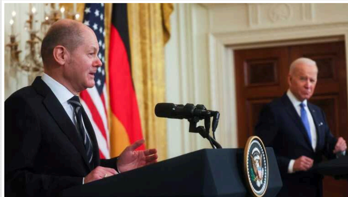
Шольц провів перемовини з Байденом: Німеччина надасть Україні військові товари на понад 7 мільярдів євро

Президент США Джо Байден і канцлер Німеччини Олаф Шольц провели телефонну розмову у вівторок, щоб обговорити, серед іншого, нагальність подальшої підтримки України.