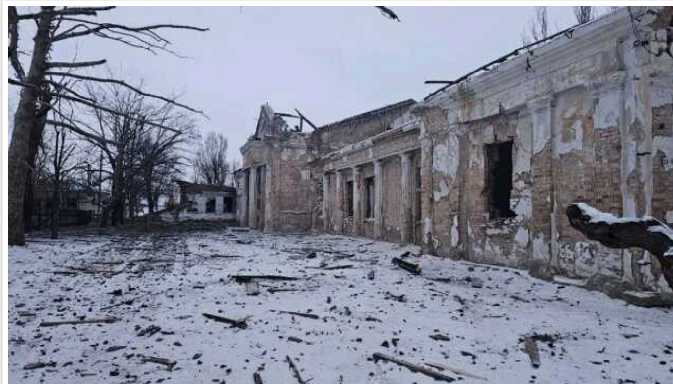
Окупанти завдали 96 ударів за добу по населених пунктах Запорізької області

Упродовж минулої доби окупанти завдали 96 ударів по 18 населених пунктах Запорізької області.