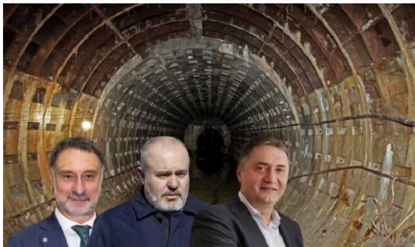
На столичній Оболоні реконструкція каналізаційного колектора здорожчала в п'ять разів

ПрАТ "АК "Київводоканал" за 141,41 млн гривень замовило продовження реконструкції каналізаційного колектора на вул. Вербовій, загальна кошторисна вартість якої за останні роки збільшилася більше ніж в п'ять разів.