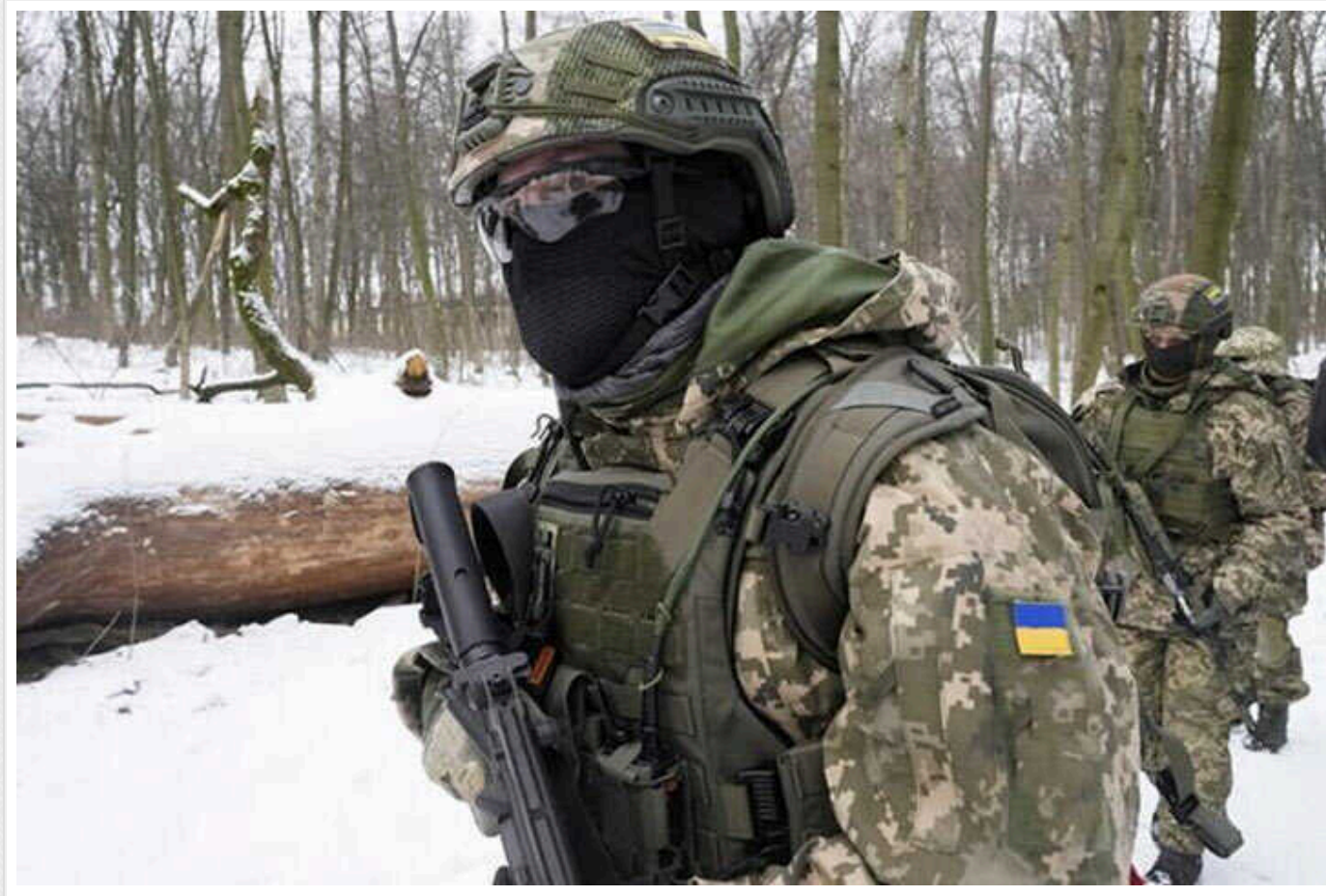
Втрати ворога: ЗСУ за добу знищили 730 окупантів і 13 танків

Сили оборони продовжують завдавати втрат країні-агресору Росії – лише за минулу добу ліквідували 730 російських солдатів, 14 ББМ, 13 танків і 10 артилерійських систем.