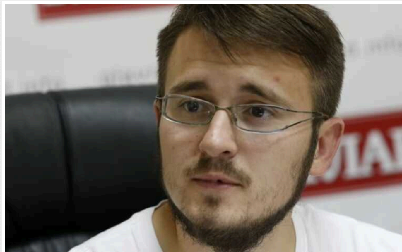
Bihus.Info: опубліковане відео свідчить, що за журналістами проєкту вели стеження близько року

Відео з матеріалів стеження та прослуховування журналістів проєкту розслідувань Bihus.Info свідчить, що за ними стежили близько року.