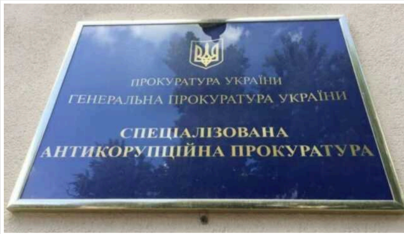
Спеціалізована антикорупційна прокуратура завершила розслідування у справі про збитки "Енергоатому" на 100 мільйонів гривень

Правоохоронці завершили слідство у справі заволодіння 100 млн грн під час будівництва сховища відпрацьованого ядерного палива.