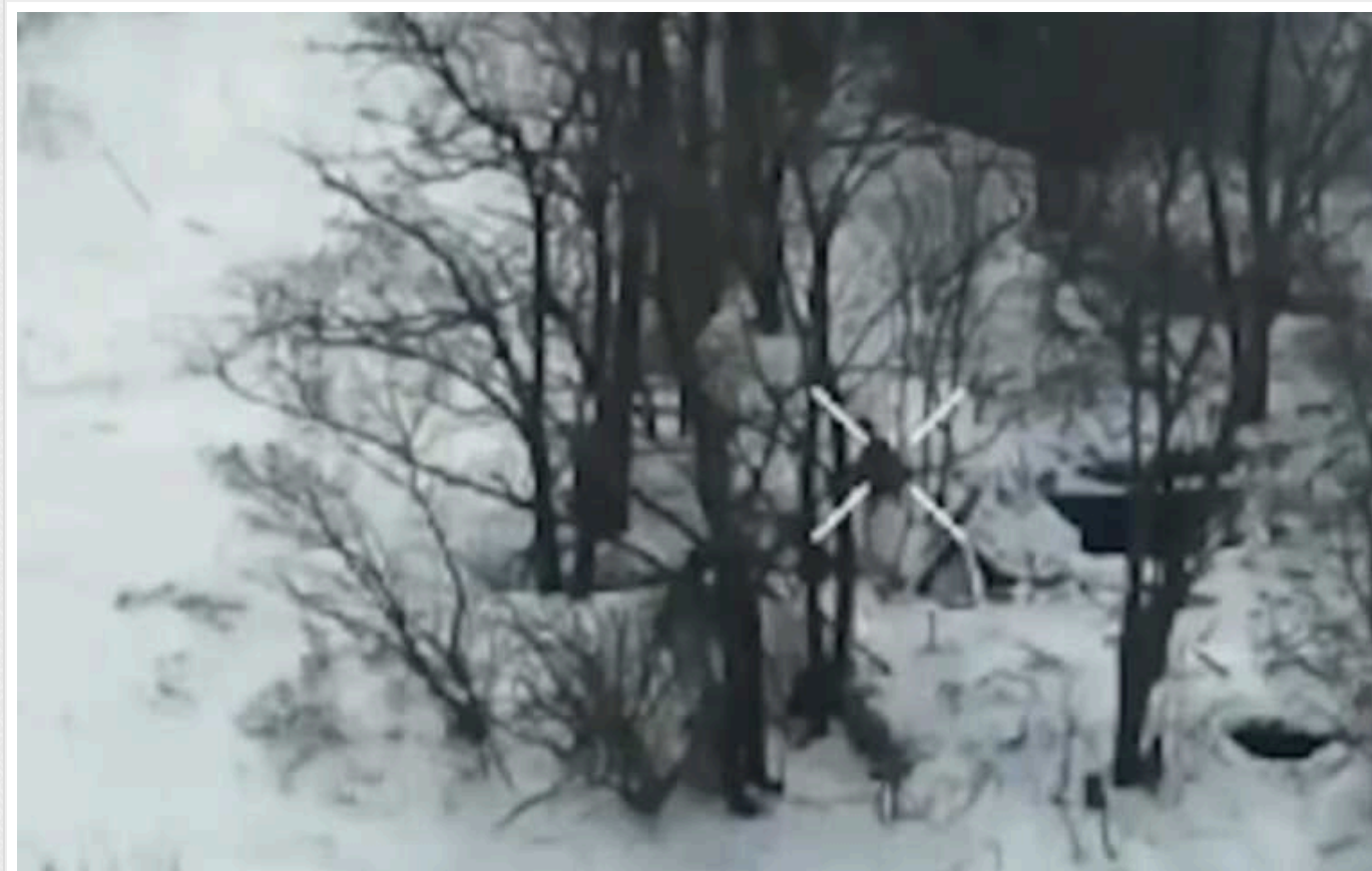
Півдужини окупантів зникають після прильоту української міни

Українські мінометники на південному напрямку поцілили у групу із шести окупантів та знищили їх.