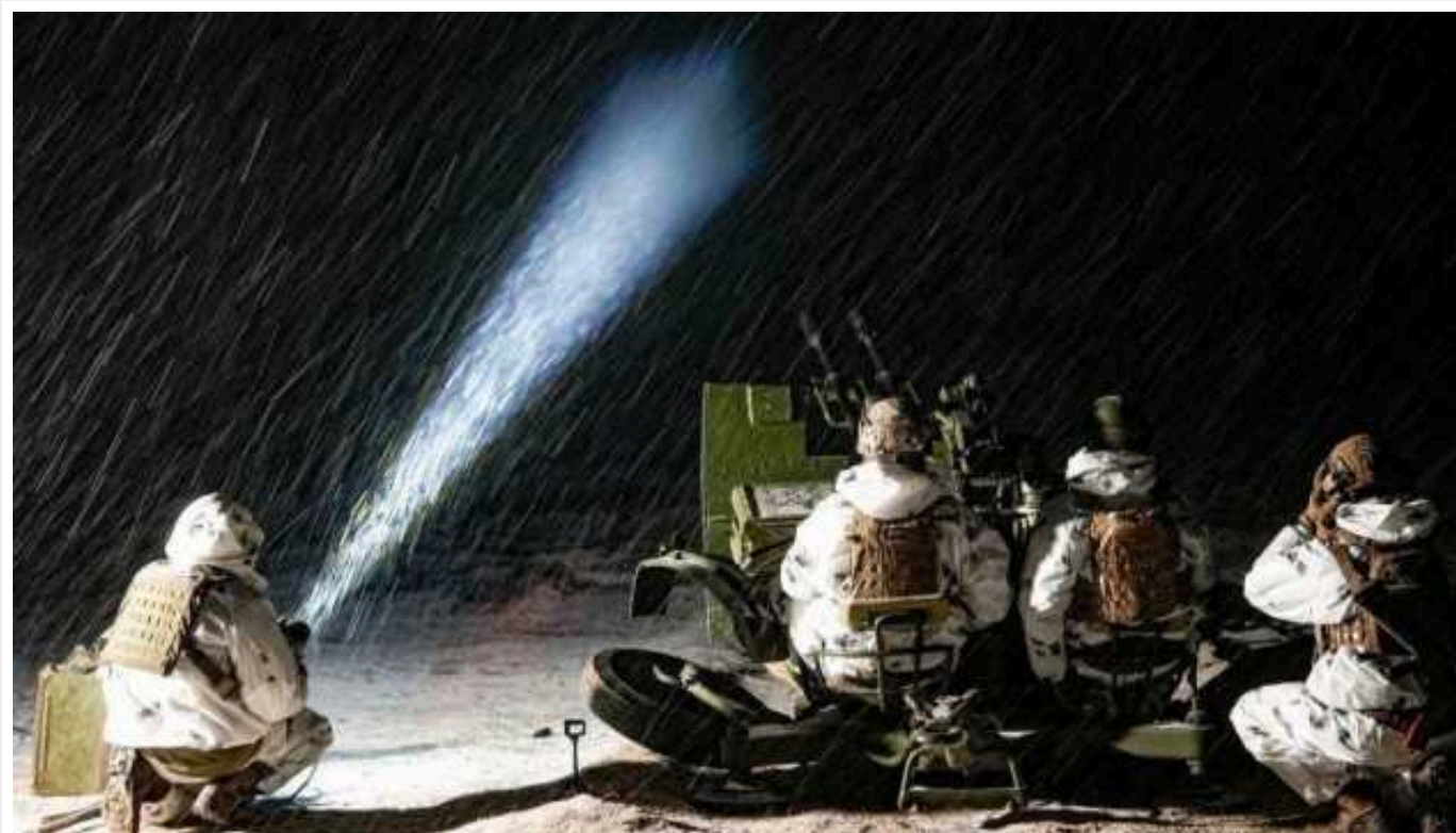
Ситуація на фронті: Сили ППО вночі знищили 19 з 20 БПЛА

Вночі російські окупанти завдали чергового авіаційного удару, застосувавши 20 ударних БПЛА типу Shahed-136/131. Силами та засобами протиповітряної оборони України 19 ударних БПЛА було знищено.