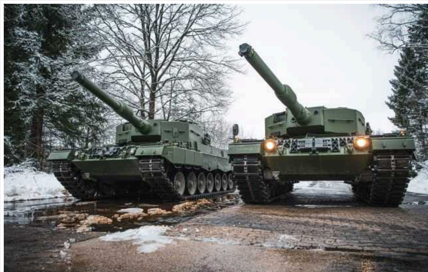
Данія та Нідерланди підготували для передачі Україні перші два танки Leopard 2

Нідерланди та Данія підготували два перші танки Leopard 2 А4 для передачі збройним силам України.