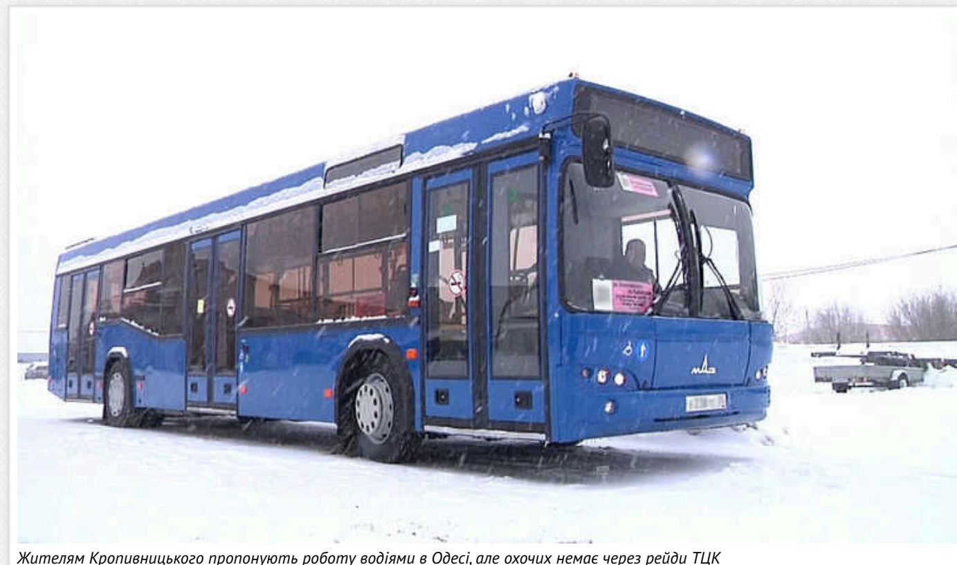
Жителям Кропивницького пропонують роботу водіями в Одесі, але охочих немає через рейди ТЦК

Жителям Кропивницького пропонують роботу водіями автобусів в Одесі.