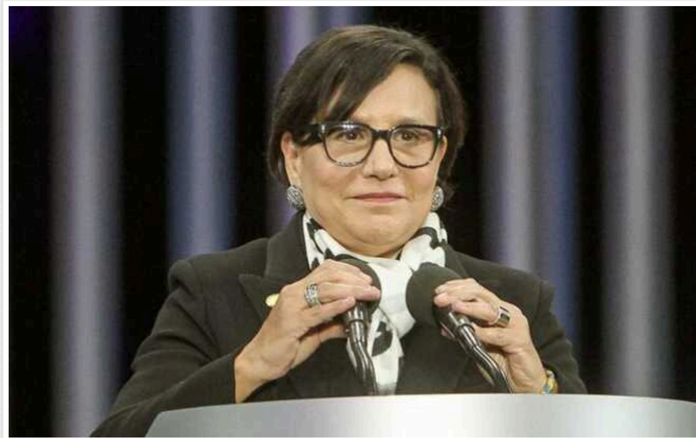
У США заявили, що конфіскувати активи РФ на користь Києва не буде просто

Сполученим Штатам буде проблематично конфіскувати заморожені активи РФ та передати їх Україні.