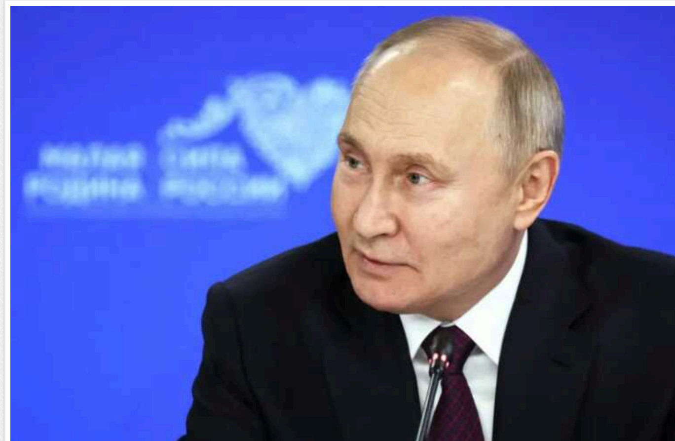
Путін заявив, що росіянам важко жити на Заході через спільні туалети для хлопчиків і дівчаток

Президент країни-агресора Володимир Путін заявив, що багато росіян повертаються з еміграції через спільні туалети для хлопчиків та дівчаток.