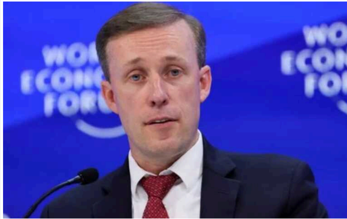
Салліван тонко потролив Путіна: "Армія РФ колись була однією з найкращих"

Стратегія США полягає у позбавленні Росії доступу до критичних ресурсів та наданні Україні технологій, які можуть змінити ситуацію на полі бою, заявив радник Джо Байдена з національної безпеки Джейк Салліван.