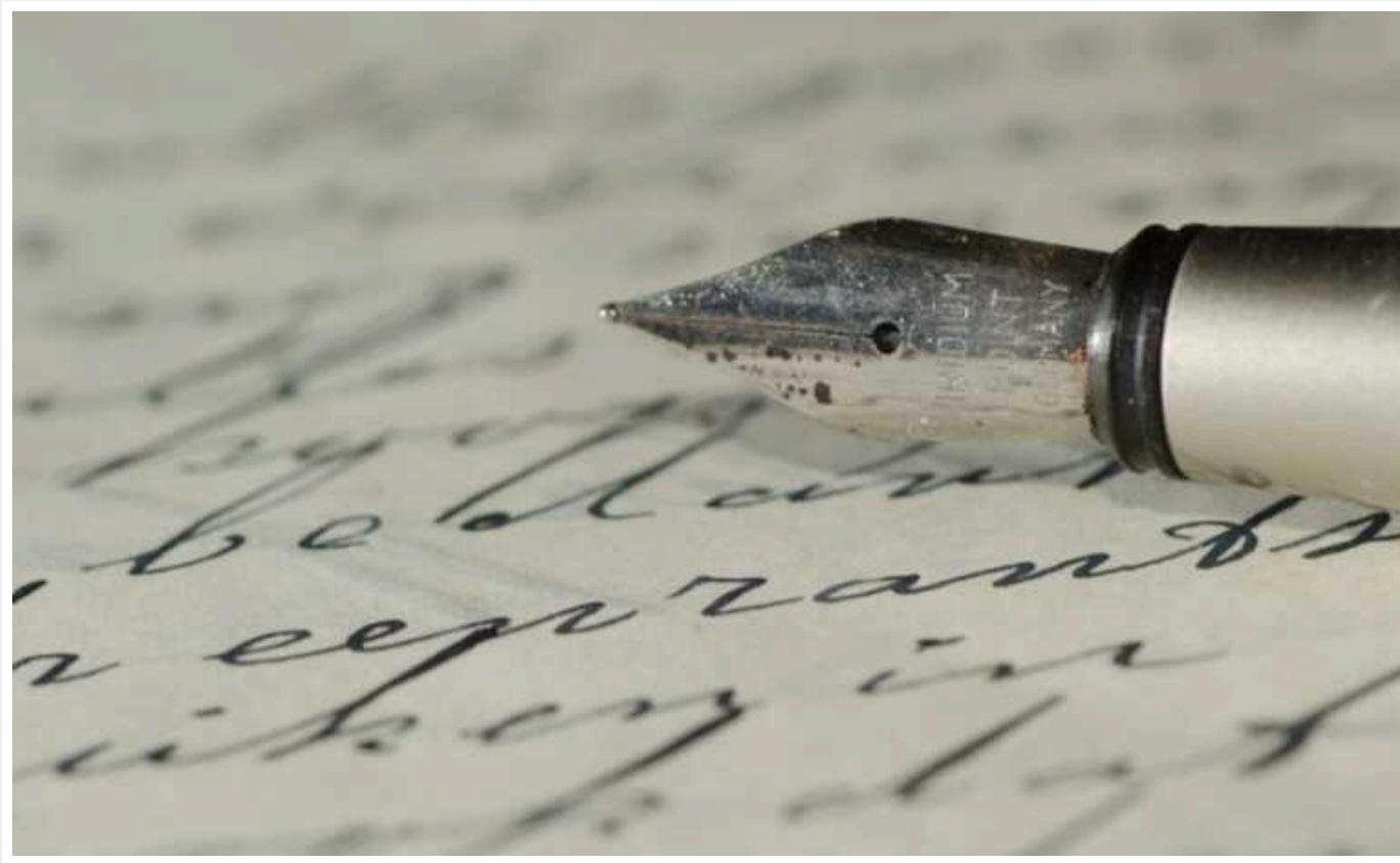
Bloomberg: ШІ навчився імітувати почерк людини

Як стверджують творці нової технології ШІ, потенціал функції з імітації почерку людини величезний – від розшифровки почерку лікарів до створення персоналізованої реклами.