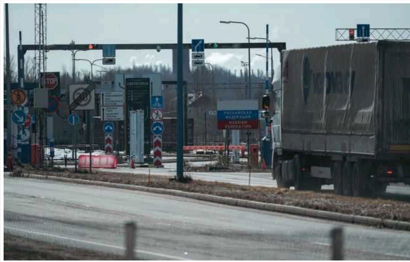
Фінляндія в лютому не відкриє кордон із РФ, - ЗМІ

Уряд Фінляндії не планує відкривати пункти пропуску на кордоні з Росією у лютому.