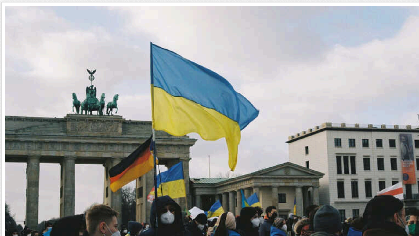
Tagesschau: Українці в Німеччині тепер частіше зазнають образ

Деякі українці скаржаться, що це відбувається через патріотичні символи (на машині, наприклад), а деякі розповіли, що таке ставлення до біженців з України через те, що вони розмовляють українською.