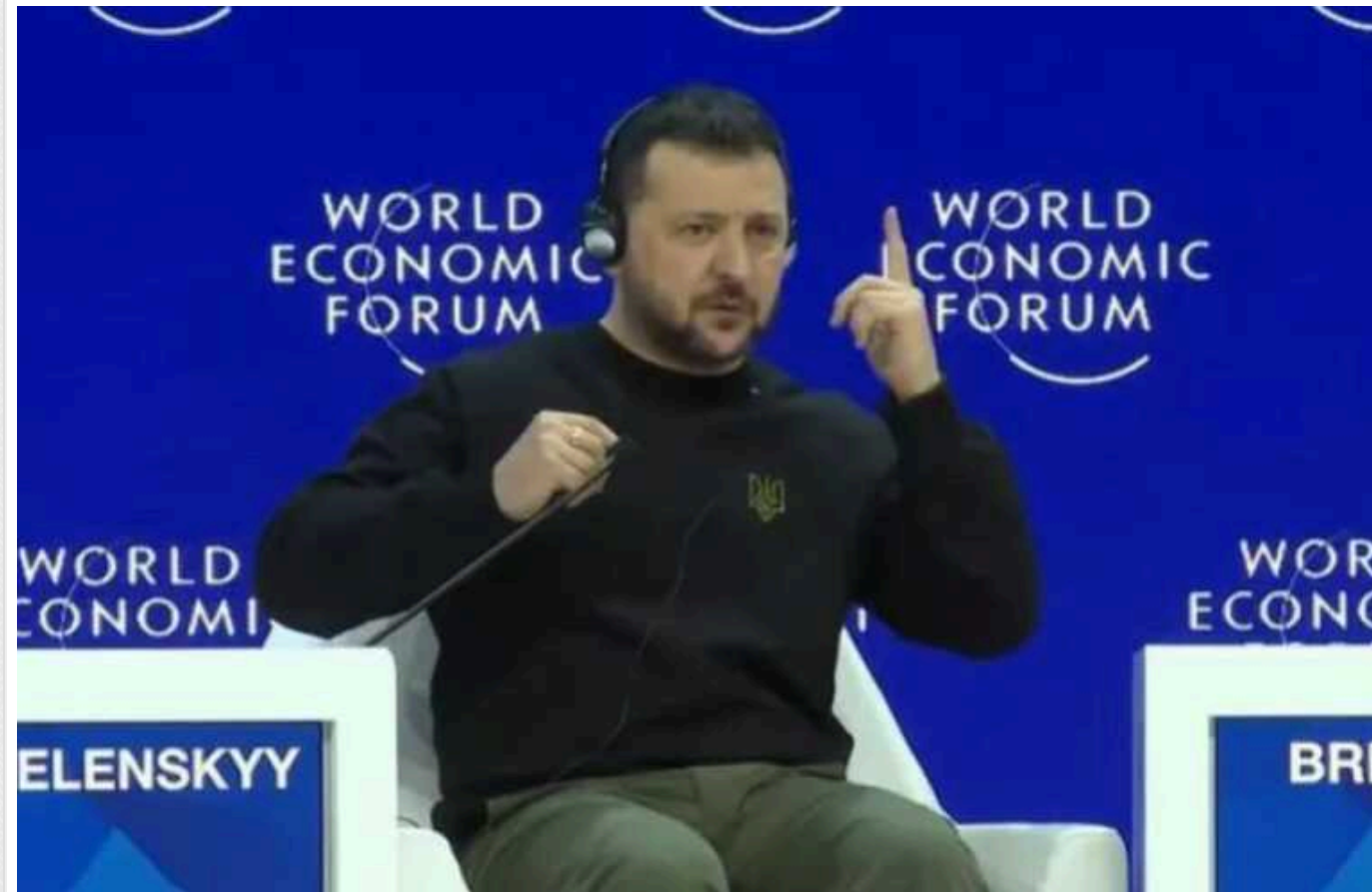
Зеленський у Давосі: Путін - хижак, який не їсть заморожені продукти

Урок успішних бойових дій Сил оборони України очевидний: чим більші втрати зазнає російська армія, тим меншою стає її загрозливість.