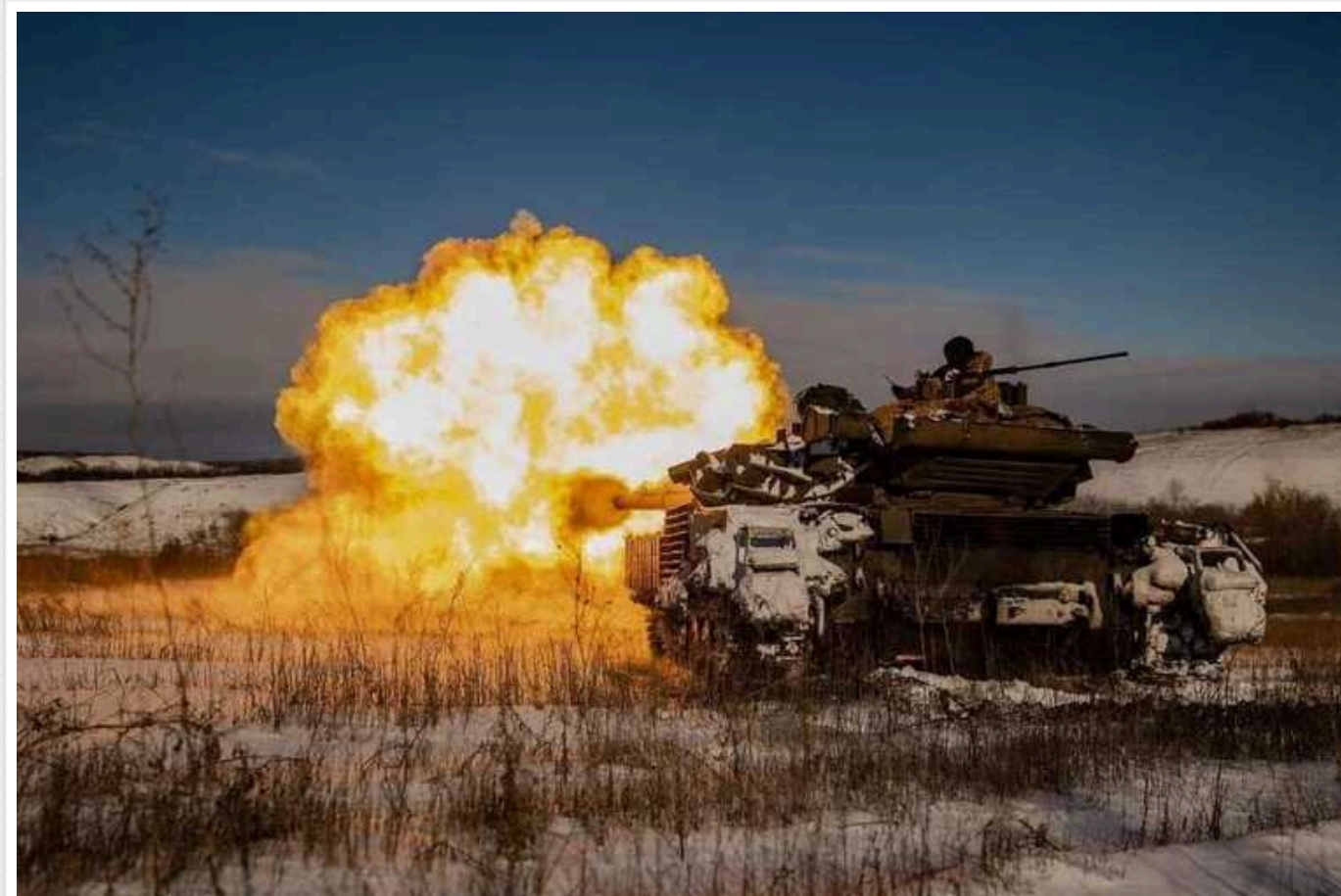
У ЗСУ показали знищення ворожого танка на Лиманському напрямку

Українські воїни продовжують нищити ворожу техніку на своїй землі. Цього разу було ліквідовано ворожий танк на Лиманському напрямку.