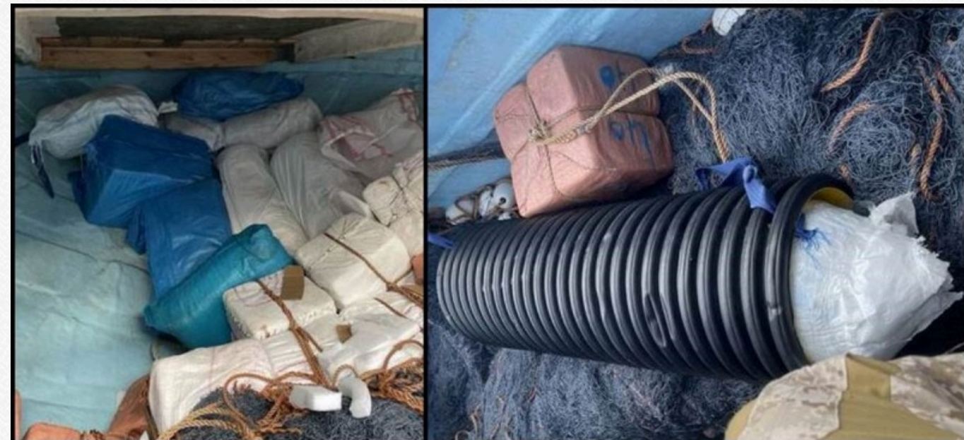
Фото: зброя, яку вилучили у хуситів ( twitter.com/CENTCOM )

Як зазначили у командуванні, судно з іранською зброєю перехопили 11 січня вночі. Його штурмували морські котики США за підтримки вертольотів та дронів. Це сталося поблизу узбережжя Сомалі в міжнародних водах Аравійського моря.