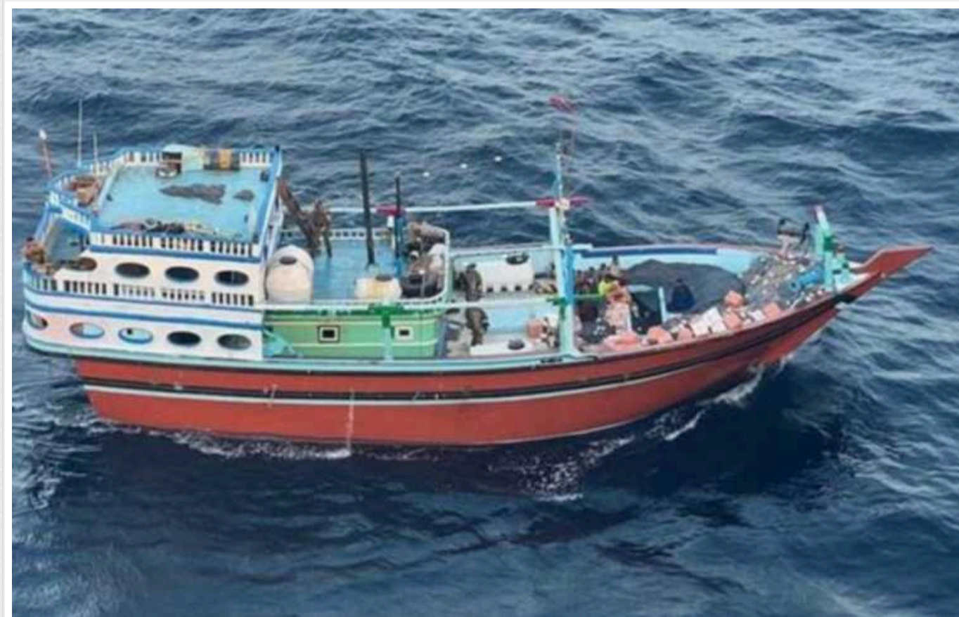
ВМС США перехопили компоненти ракет, які Іран хотів передати хуситам

Військово-морські сили Сполучених Штатів Америки перехопили іранську зброю, яку мали доставити хуситам. Постачання здійснювали за допомогою судна.