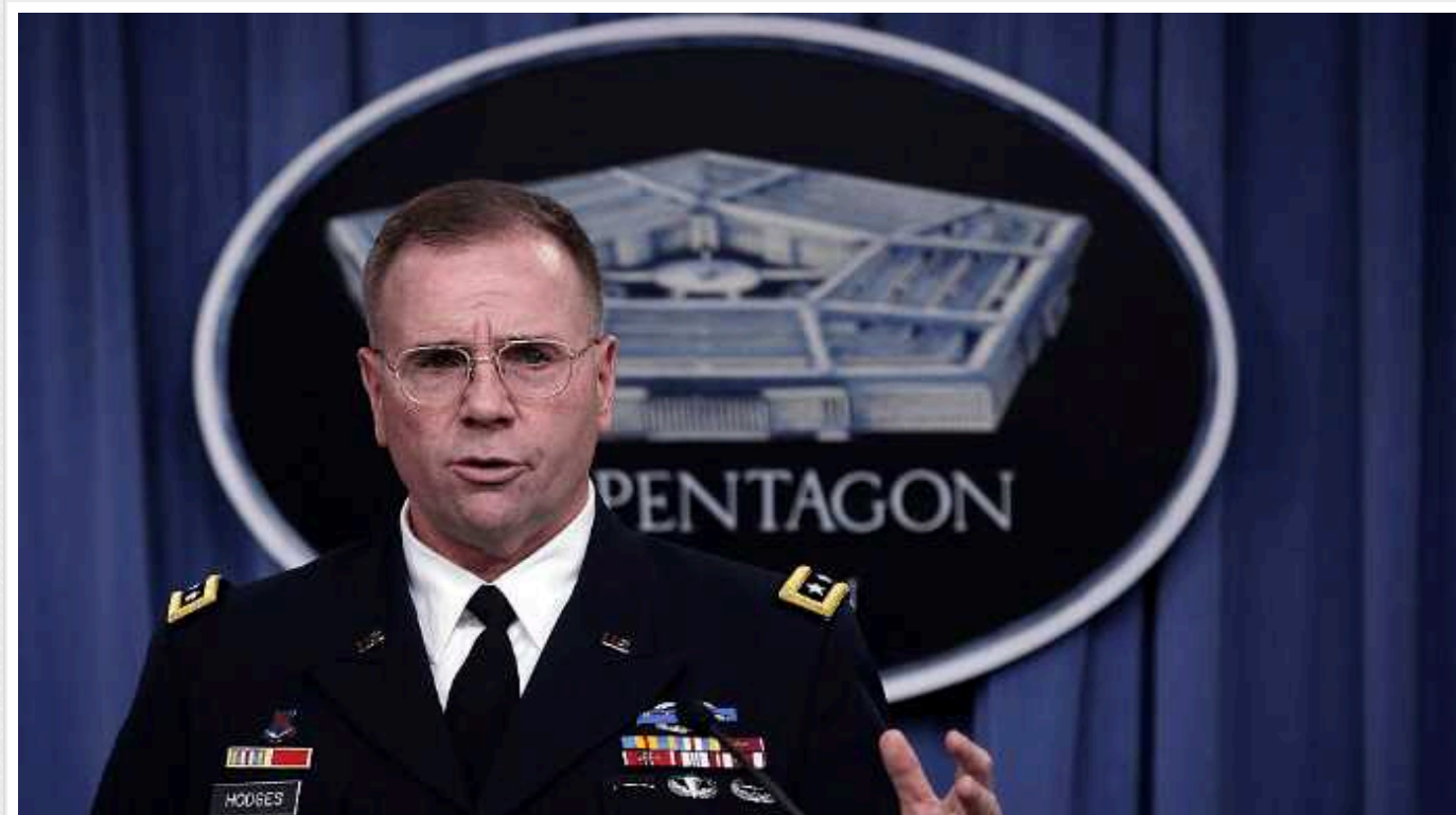
Генерал США оцінив плани Путіна воювати проти України 5 років

Президент Росії Володимир Путін раніше озвучив плани воювати в Україні 5 років. Колишній командувач Сухопутних військ США в Європі, генерал-лейтенант Бен Годжес в інтерв'ю виданню Sestry оцінив, чи здатна на це Росія.