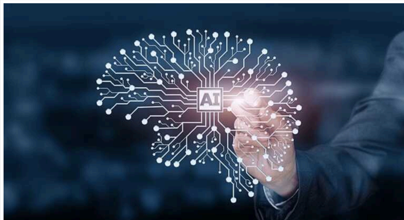
ШІ замінить у світі 40% робочих місць, – МВФ

Штучний інтелект (ШІ) у перспективі може замістити близько 40% робочих місць у світі. При цьому ШІ, ймовірно, вплине на 60% робочих місць у розвинених економіках і на 26% – у державах з низьким рівнем доходу, що також вплине на нерівність між країнами.