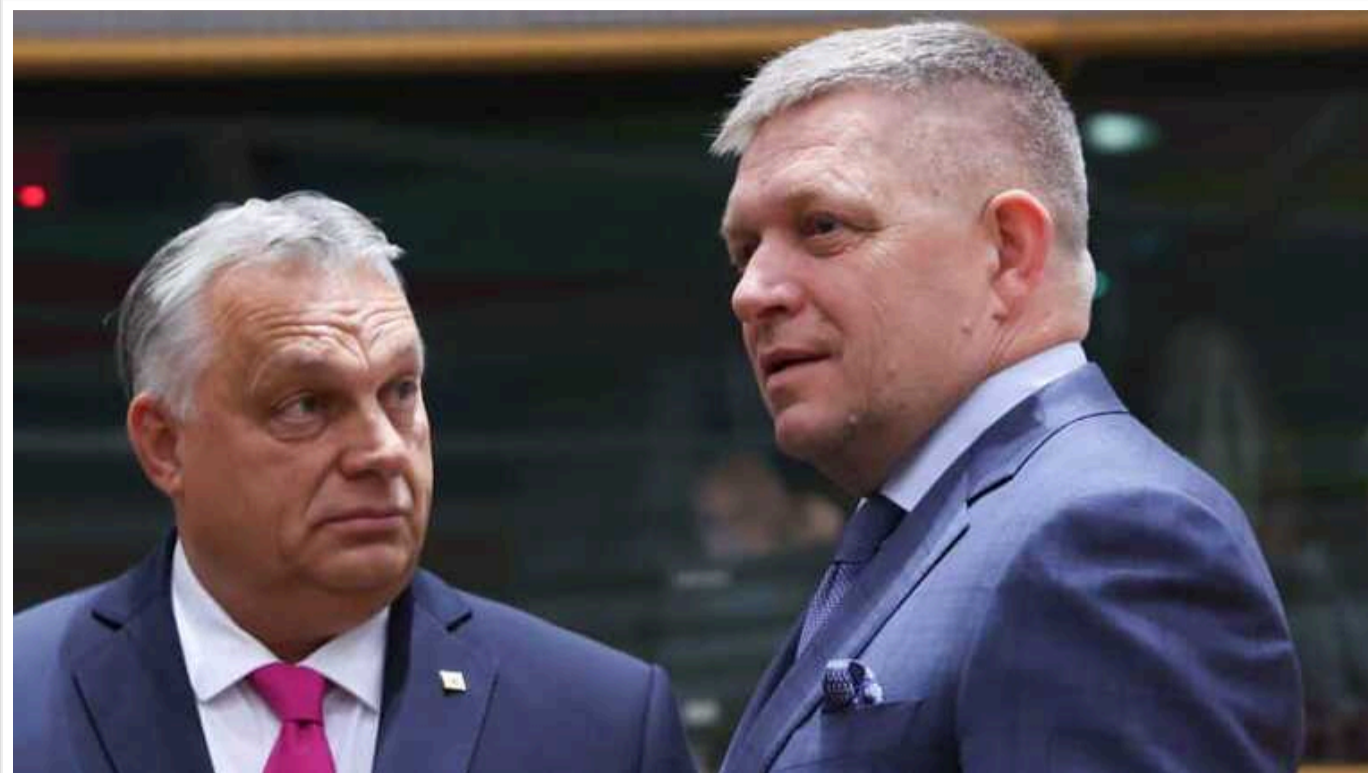
Словацький прем'єр Фіцо після зустрічі з прем'єром Угорщини Орбаном у Будапешті заявив, що підтримує його "законну" боротьбу проти змін до бюджету ЄС для надання Україні 50 мільярдів євро допомоги

Коментуючи позицію Угорщини щодо блокування перегляду бюджету ЄС для створення програми чотирирічної підтримки України, Фіцо сказав, що навіть у разі виділення цих коштів "через два-три роки" нічого не зміниться.