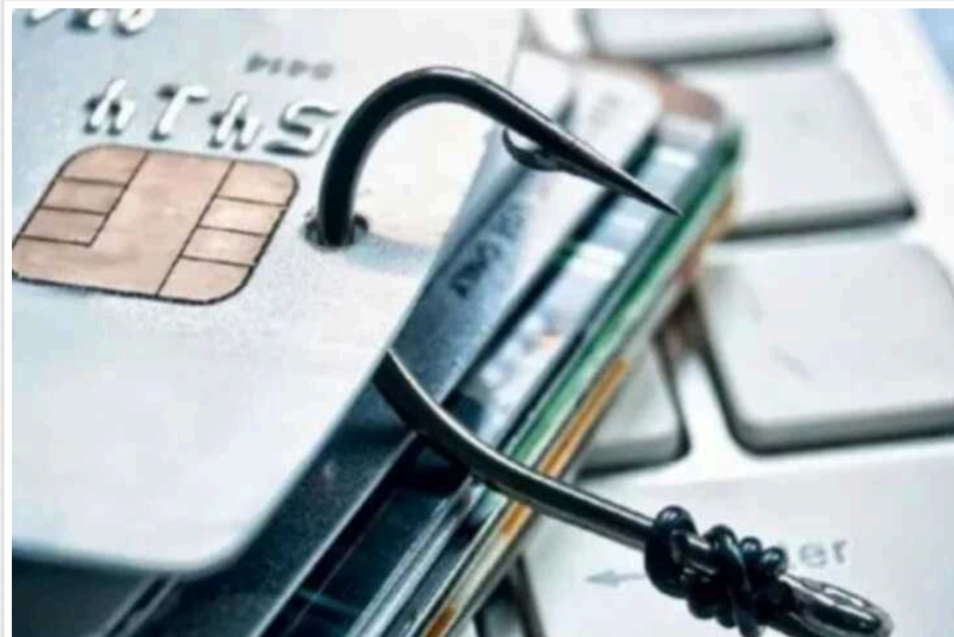
Аферисти дурять українців на десятки тисяч гривень за допомогою фішингу: як не потрапити на схему шахраїв

Двоє жителів Херсона стали жертвами шахраїв, які використовували фішингові посилання для продажу товарів у інтернеті. Причому аферисти використовують різні приводи для ошукування українців.